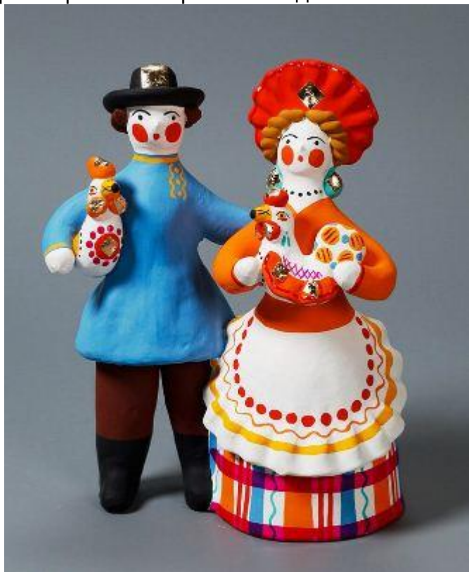
Дымковская игрушка « Парочка ».

В дальнейшем мастера занялись изготовлением глиняных фигурок на постоянной основе. При этом значительно расширился ассортимент изделий.