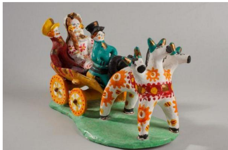
Дымковская игрушка «Тройка».

Позднее изготовлением ярких забавных фигурок стали заниматься целыми семьями. Долгими зимними вечерами мастера и их домохадцы вместе замешивали пластичную массу из глины, лепили небольшие игрушки, а после высушивали их и обжигали в печи при высокой температуре. Далее изделия расписывали вручную.