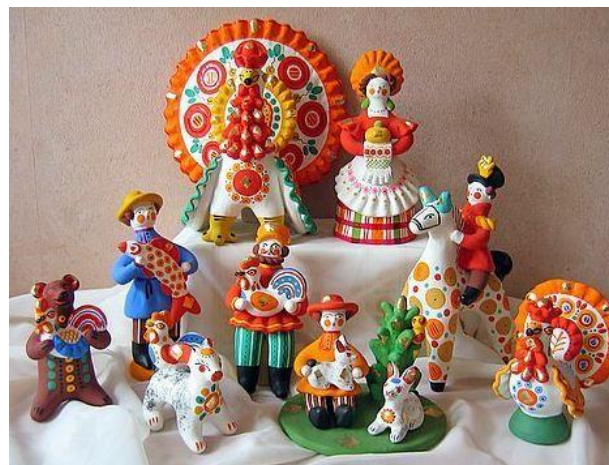
Образцы дымковских игрушек

Это касается всех этапов создания глиняных фигурок, начиная от процесса лепки до росписи. Именно уникальность, своеобразие и широкая вариативность форм и являются изюминкой дымковской игрушки.