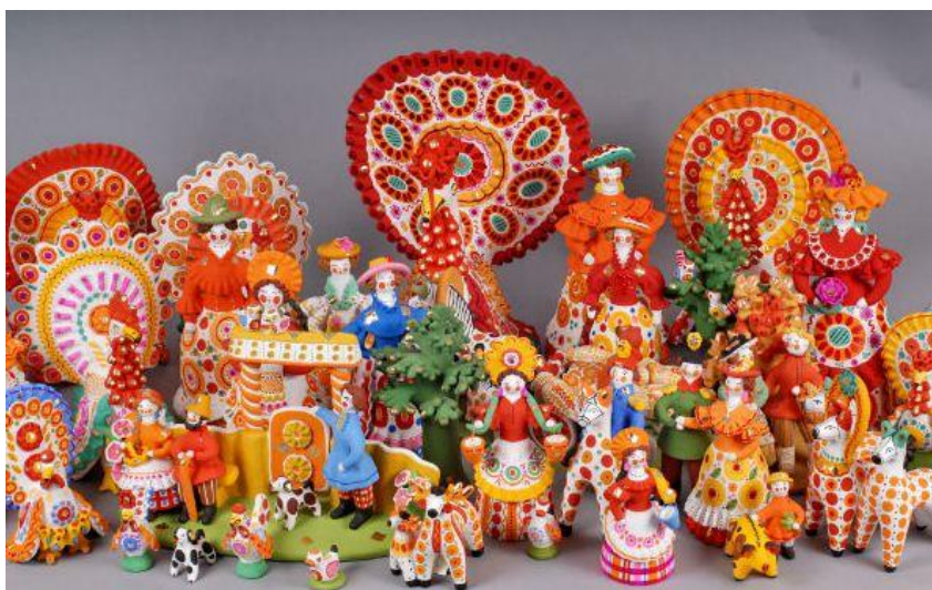
Яркие дымковские фигурки

Дымковские игрушки являются изделиями ручной работы, поэтому каждой из них присуща индивидуальность. Нет и не может быть двух одинаковых фигурок, потому что мастер вкладывает в свою игрушки особенные характерные черты.