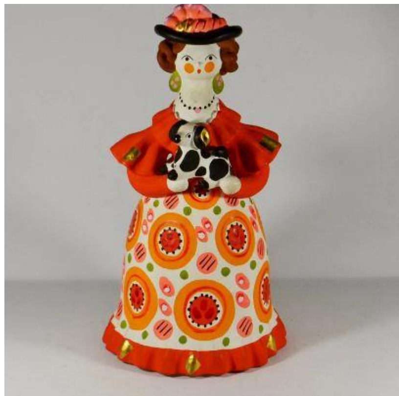
Дымковская игрушка « Дама с собачкой »

Тогда маленькие яркие статуэтки стали возить на продажу в Оренбургскую область, в Москву и другие крупные города, где часто устраивались ярмарки и были открыты специальные лавки по продаже игрушек и сувениров.