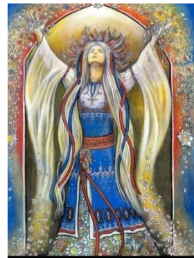
Лада или Летница

Первая часть периода, с начала апреля до середины мая, пройдет под воздействием стихии Огня. Напомним, что Тур не имеет к ней никакого отношения, так что рассчитывать на его помощь не приходится, и потому необходимо быть особенно внимательными и предусмотрительными. В это время возникнет много сложных, запутанных ситуаций. Конфликты могут вспыхивать моментально, но и затихнут быстро, если проявить терпение и доброжелательность. Нельзя поддаваться на провокации, позволять манипулировать собой. Если вы способны держать под контролем огненную стихию (в частности, управлять своими чувствами), период может оказаться удачным для создания новых отношений. С середины мая до конца июня мы вновь ощутим воздействие стихии Земли. Готовьтесь к сложным задачам и упорному труду, старайтесь грамотно распределять ресурсы. Это касается и работы, и финансов, и личных отношений.